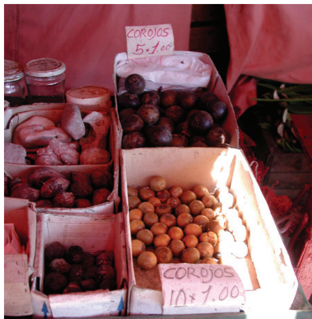
Figura 3. Venta de semillas, raíces, cortezas y resinas de uso medicinal.