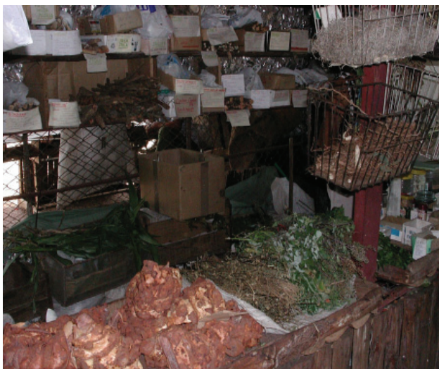
Figura 2. Hojas, frutos, cortezas y semillas son las partes más usadas con fines medicinales.

frescas, mientras que las partes como semillas, raíces, cortezas y resinas de algunas plantas, para algún uso específico medicinal, se venden secas (Fig. 3). La mayor parte de los remedios que se ofrecen son para prepararse como decocción (51.6%), infusión (39.1%), jugos (13.0%) y cataplasmas (8.7%).