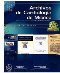
IMAGEN EN CARDIOLOGÍA