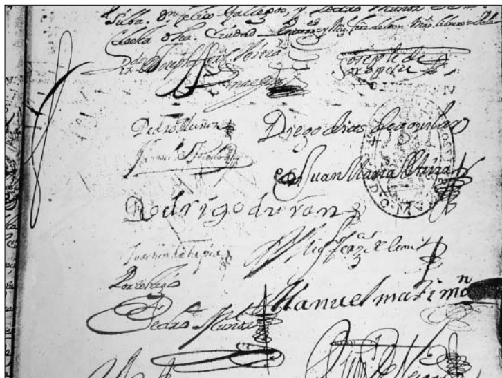
2b. Firma de Pedro Muñoz, Archivo General de la Nación, Expolios , t. 15, exp. 1, 1721, f. 28.

carpintero y no la del testigo. 11 Si el carpintero de la sillería de coro, el maestro que realizó el avalúo de los bienes del obispo y quien se examinó en los ramos de carpintería de lo blanco y ebanistería son la misma persona, ¿cómo explicar el interés de Pedro Muñoz en examinarse de nuevo?