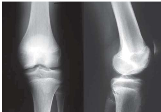
Figura 1. Caso 1: radiografías anteroposterior-lateral de la rodilla izquierda al inicio del cuadro.

se apreció una lesión osteocondral en el cóndilo femoral interno en la zona de carga con fragmento in situ ; se realizó una resonancia magnética (RM) (Figura 2) en la cual se apreció una lesión osteocondral en tróclea en el borde externo con desprendimiento de fragmento condral hacia el receso suprapatelar y una lesión osteocondral en el cóndilo femoral interno en la zona de carga con fragmento in situ .