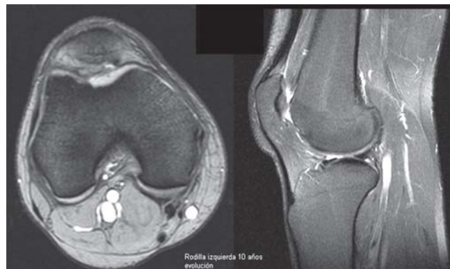
Figura 7. Caso 2: Rodilla izquierda evolución a 10 años.

y edema en carilla articular lateral de patela. En el surco intercondíleo, se encuentra cuerpo libre cartilaginoso de 2 x 1 cm que se extrae y se realizan microfracturas pertinentes del lecho de la lesión.