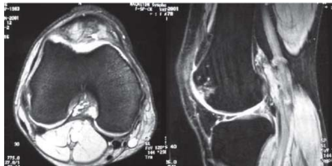
Figura 5. Caso 2: Resonancia magnética de la rodilla izquierda.

El paciente es intervenido nuevamente, realizándole artroscopía de rodilla izquierda y encontrando edema en tróclea por lateral y hundimiento sin irregularidad del cartílago