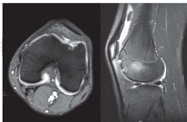
Figura 2. Caso 1: Resonancia magnética de la rodilla izquierda inicial.