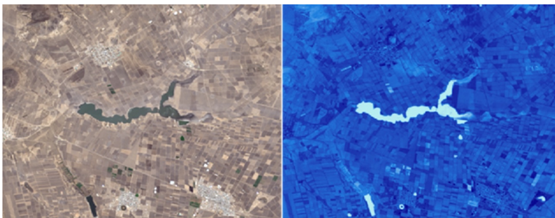
Figura 2. Imagen natural (a) e imagen con índice de agua de diferencia normalizada (NDWI) (b) de la laguna San Antonio Atocha, municipio de Apan, Hidalgo, México.

La teledetección se realiza a través de más de 200 bandas que detectan la longitud de onda de los objetos de interés. Estas bandas pueden combinarse, resultando en una serie de índices útiles para comprender el comportamiento de la superficie evaluada. Los índices son ecuaciones matemáticas o proporciones de bandas espectrales diseñados para identificar relaciones funcionales y de cambio entre diversas superficies (Kasampalis et al. , 2018). Son notorias las diferencias entre una imagen satelital al natural de un cuerpo de agua y una imagen en la cual se resalta mediante un índice como el NDWI (Figura 2).