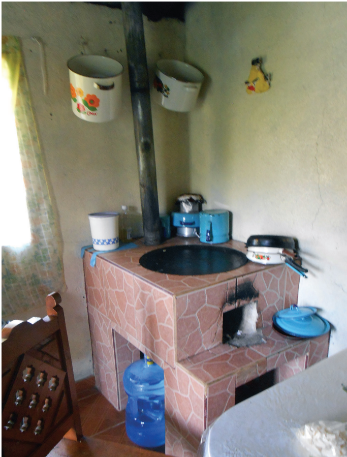
Figura 8. Ejemplo de una estufa Patsari con mejoras estéticas.

En cuanto a otras características técnicas identificadas en la revisión bibliográfica, se deben contemplar aspectos como el mantenimiento, uso y operación de la vivienda y/o su tecnología, incluida su apariencia externa. Como demostró un estudio de GIZ, 73 las mejoras estéticas de las cocinas y los dispositivos potencian el uso y la