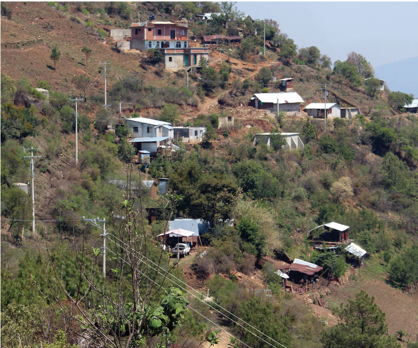
Figura 5. Ejemplo de comunidad rural de la sierra de Oaxaca.

Las definiciones de vivienda rural puntualizan cuestiones como la ubicación, el entorno, lo social, lo ambiental y lo económico. Sánchez y Jiménez 25 la visualizan y estudian con un enfoque multi e interdisciplinario para comprender las labores agrícolas en determinados ecosistemas, las relaciones internas y externas de las familias que viven en ellas y sus relaciones con otras familias, que en conjunto construyen las redes del tejido social de las comunidades rurales (Figura 5).