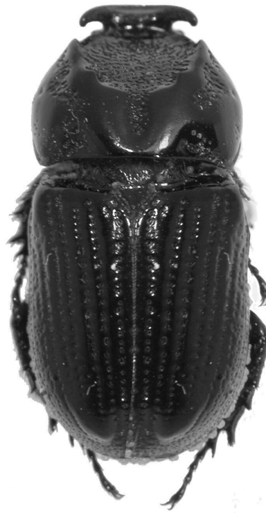
Figura 1. Amblyodus taurus Westwood (ejemplar macho colectado en la región Amazónica, por los investigadores P. Bührnheim e N.O. Aguiar). A: vista lateral. B: vista dorsal.