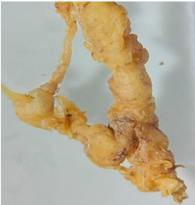
Figura 1. Raíces de plantas de pepino con agallas. Figure 1. Cucumber plant roots with galls.

En las muestras de raíces se observaron síntomas característicos de agallas y deformaciones (Figura 1) donde se encontraron hembras globosas y masas de huevos (Figuras 2a y b), las cuales fueron extraídas manualmente.