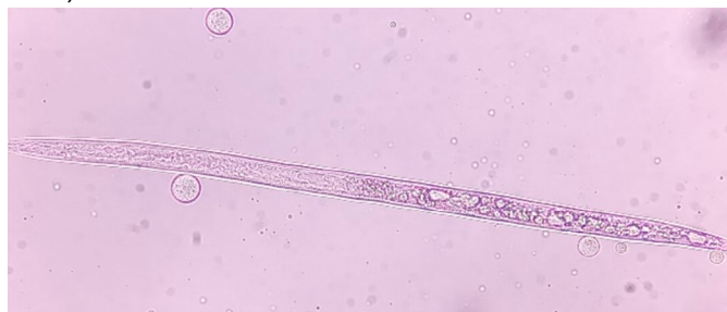
Figura 5. Meloidogyne incognita expuesto al tratamiento de Bacillus velezensis .

spp. y Xiphinema spp. En el cultivo de pepino se encontró a Meloidogyne sp. y Pratylenchus sp, los cuales representan riesgo en este cultivo. La presencia de Pratylenchus sp. es de suma importancia, ya que es un nematodo lesionador de las raíces hospederas, ocasionando heridas en el sistema radical como vía de entrada para otros fitopatógenos como hongos y bacterias (Villain et al. , 1999). Especies del género Aphelenchoides son fungívoros y están asociados a tejidos en descomposición (Yeates, 1999), en este análisis se encontró a este género en menor cantidad que Meloidogyne sp. Estos nematodos se encuentran en una gran diversidad de plantas asociadas, no tienen hospedero específico (Sánchez-Monge et al. , 2015), ya que se han reportado más de 700 especies de 85 familias botánicas (Kohl, 2011). Dentro de este género se encuentran los nemátodos foliares y de los brotes que causan deformaciones y necrosis en hojas, como A. ritzemabosi , A. fragarie y A. besseyi , que invaden hojas y tejidos de una gran cantidad de especies de plantas (Idowu and Keneth, 2021), estos daños no se observaron en las plantas seleccionadas para muestreo. Este género también se puede comportar como ectoparásito, afectando puntos de crecimiento (Eppo, 2017).