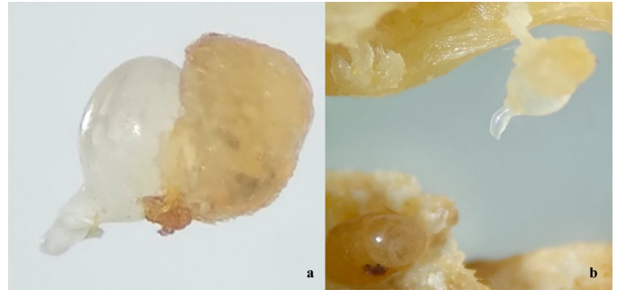
Figura 2. a) Hembras de Meloidogyne incognita y b) masas de huevos presentes en raíces de Pepino.

Los nematodos juveniles de M. incognita expuestos a los filtrados bacterianos de P. fluorescens en las dos concentraciones, mostraron mortalidad a partir de las 24 h, siendo los tratamientos con mayor actividad nematicida sin diferencia significativa entre estos ( P < 0.05 ). En la concentración más alta se presentó 95.9 % de mortalidad, y en la concentración de 50 % un 93.75 %.