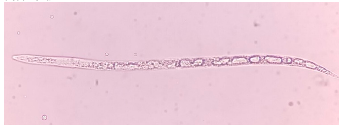
Figura 7. Meloidogyne incognita expuesto al tratamiento de Bacillus vallismortis .

Figure 6. Meloidogyne incognita exposed to Pseudomonas fluorescens treatment.