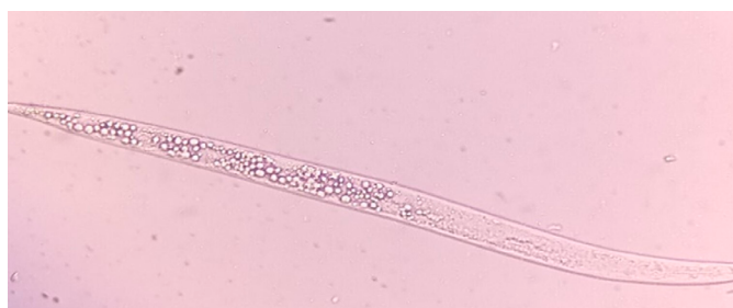
Figura 6. Meloidogyne incognita expuesto al tratamiento de Pseudomonas fluorescens .

Figure 5. Meloidogyne incognita exposed to Bacillus velezensis treatment.