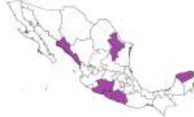
Figura 3 Nivel de avance en las actividades del Componente de Detección y Atención Oportuna en las entidades federativas, realizadas por la Comisión Nacional de Protección Social en Salud (CNPSS) en conjunto con el Centro Nacional para la Salud de la Infancia y la Adolescencia (CeNSIA), el Hospital Infantil de México Federico Gómez (HIMFG) y los Servicios Estatales de Salud.

F. Centros regionales de desarrollo Infantil y estimulación temprana en operación en cinco entidades