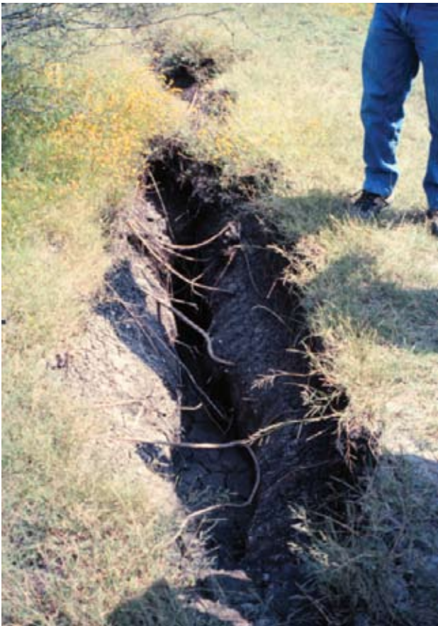
Figura 1. Falla por subsidencia en Salamanca Guanajuato, México.

Los primeros reportes que relacionan los hundimientos del terreno con la extracción de agua fueron realizados por R. Fuller en 1908 (Poland, 1984). El primero en tratar de explicar científicamente el fenómeno fue Terzaghi (1925) quien propone una ecuación de consolidación unidimensional. Dicho trabajo fue retomado por Meinzer (1928) quien reconoció que la extracción de agua del almacenamiento de un acuífero se debe a la compresión del mismo y que la disminución del almacenamiento puede ser permanente (inelástica) o recuperable (elástica). Las primeras observaciones son realizadas por Rappley y Tibbets en 1933 (citados en Poland e Ireland, 1988) en el Valle de Santa Clara en California. Posteriormente, T. Althouse asoció la extracción de agua con hundimientos en el valle de