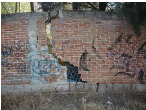
Figura 3. Afectaciones estructurales por subsidencia en Irapuato, Guanajuato, México.

Comisión Nacional del Agua o en las Comisiones Estatales, pero aun ante estas instancias no hay una forma clara de proceder cuando hay problemas debidos a subsidencia. Los grupos de Protección Civil tampoco tienen claro si la subsidencia es un desastre o un fenómeno natural. Con todo ello, no resta ningún organismo público ni privado que responda adecuadamente a los afectados.