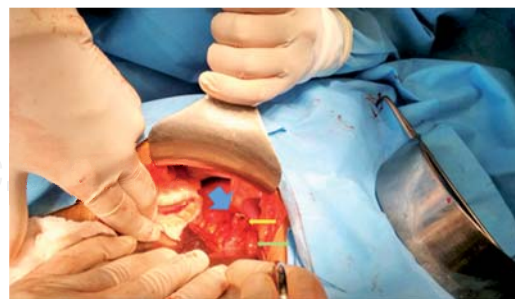
Figura 2. Flecha azul hepático accesorio desemboca en la vesícula, flecha amarilla divertículo vesicular, flecha verde colédoco.

Se colocó un drenaje mixto (sonda nelaton 24 Fr multiperforada con camisa de Penrose de 0.5") al lecho vesicular y un Penrose a la corredera parietocólica derecha.