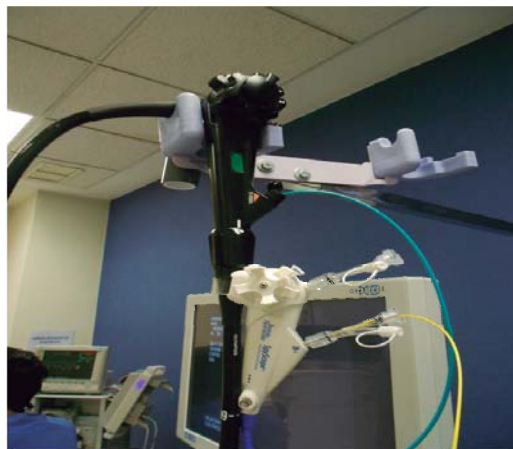
Figura 1: SpyGlass, de color azul, acoplado a la caña del endoscopio, se introduce por el canal de trabajo.

Debido a lo anterior, se decidió llevar a cabo una colangioscopia con litotripsia. Bajo anestesia general, previa intubación orotraqueal, con monitorización por el Servicio de Anestesiología, profilaxis antibiótica e indometacina 100 mg vía rectal, con el paciente en decúbito lateral izquierdo, se introdujo