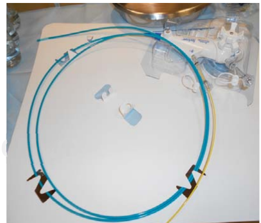
Figura 2: SpyGlass, colangioscopio de un solo uso de Boston Scientific.