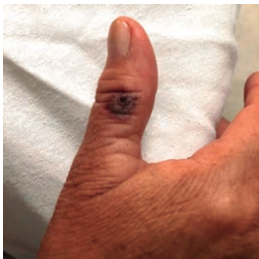
Figura 2: Lesión cutánea dermonecrotica de probable loxoscelismo.

library, Ovid, Scielo y Google académico, y agregando una nueva palabra de búsqueda de "arachnidism". La búsqueda de las distintas fuentes de información consultadas se realizó sin límite de fecha de publicación hasta marzo de 2023. Tomamos bibliografía para análisis de elegibilidad sin distinción