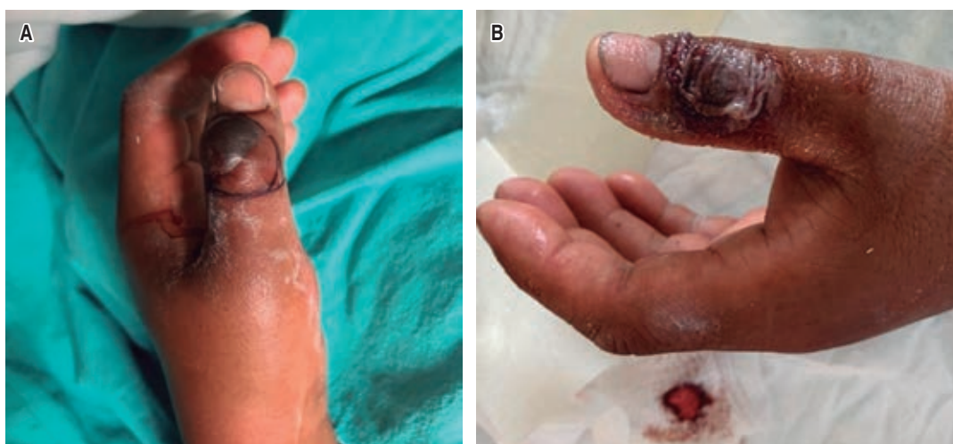
Figura 1: Paciente masculino de 38 años de edad con mordedura de araña Loxosceles , de 12 horas de evolución con placa livedoide y zona de necrosis que abarca tejido celular subcutáneo. A) Placa livedoide en dorso de dedo pulgar secundario a mordedura de araña Loxosceles . Se aprecian zonas congestivas y equimosis secundaria a la vasoconstricción e isquémica causado por el veneno en periferia de la herida. B) Se observa una lesión con ampúlas locales sin manifestaciones sistémicas con manejo local y sintomático.