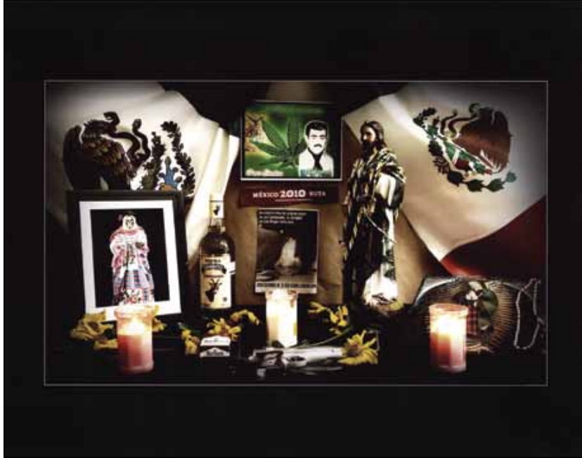
Altar de la patria