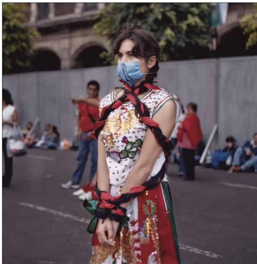
La patria atada