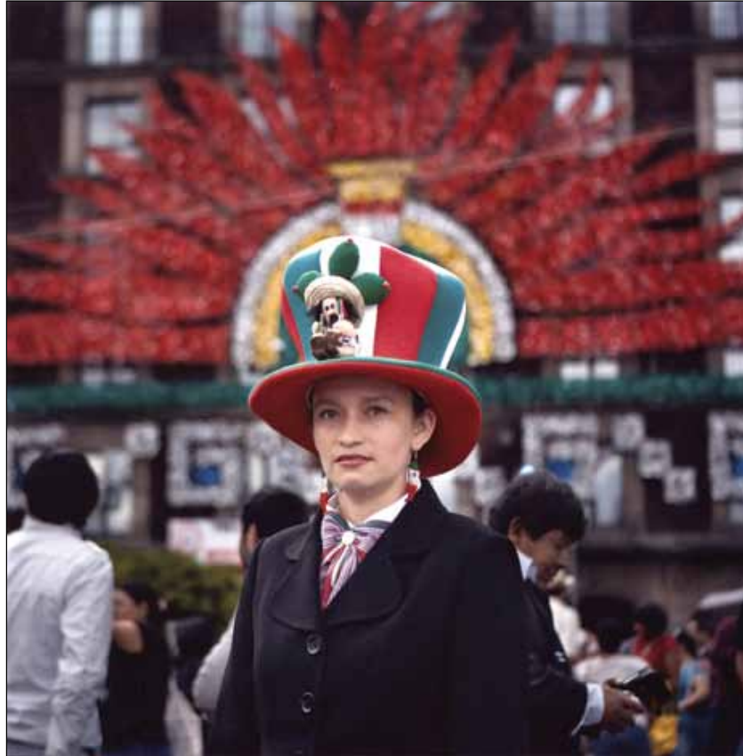
Presente y pasado