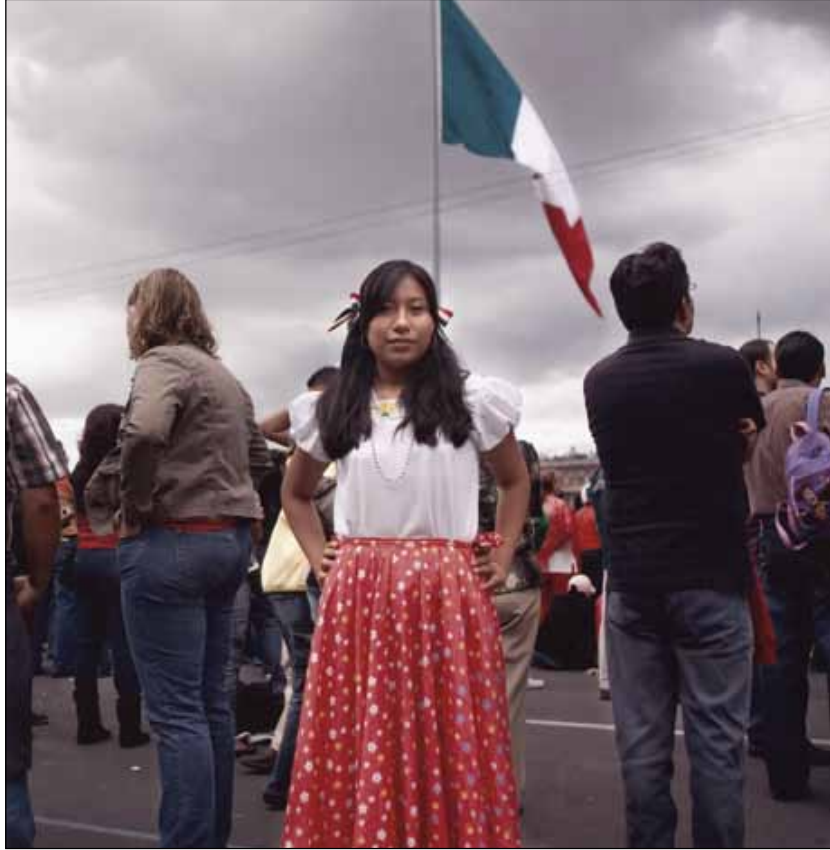
La patria al viento