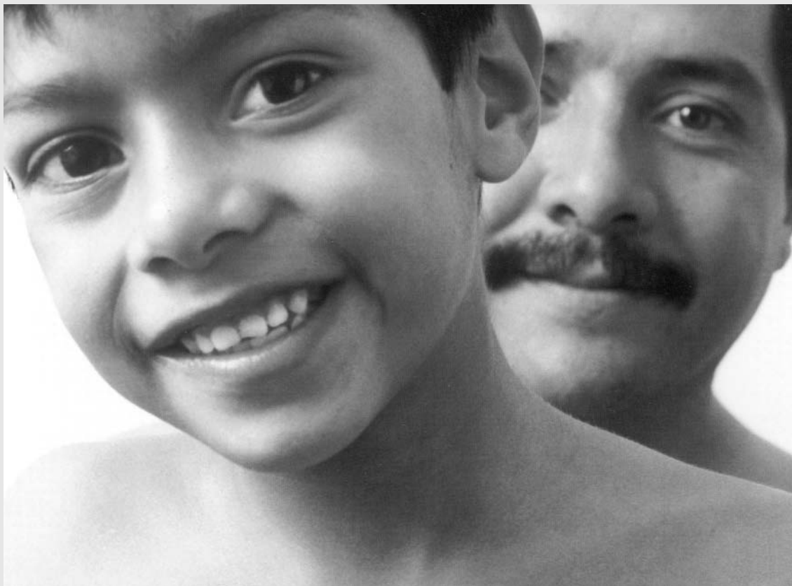
Paternidad afectiva. Calendario Coriac 2001

Soy el tercero de ocho hermanos. El mayor es un buen “hermano mayor” —ustedes comprenden qué es un hermano mayor. La segunda, única mujer viva entre siete sobreprotectores y encajosos hermanos, muy cercana y a la vez muy lejana, por ejemplo, en preferencias políticas. Luego yo. Después mi maestro, el cuarto hermano, a quien le ha tocado cargar pesado, como creo pasa en muchas de nuestras familias: hay a quienes la vida les cobra de más. Por mucho tiempo no supe ver su vida ni su historia: sietemesino, estaba muy chico cuando mi hermana, la que vino tras él, murió poco después de nacer. Mamá tenía que cuidar a mi hermano muy chico y a la vez hacer el duelo de una hija que murió al día de nacida. Quizás mamá no pudo despedirse de ella, por eso creo que, en efecto, mi hermano se ha vivido como no muy querido, cuando en realidad, mamá lo tenía a él muy pe-