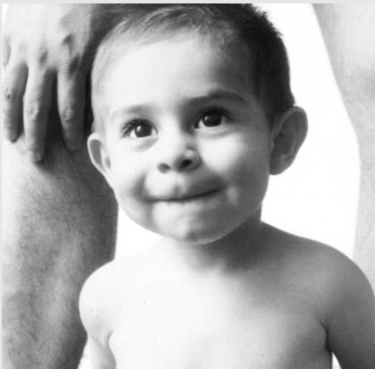
Paternidad afectiva. Calendario Coriac 2001

Antes de hablar de mí, me he preguntado la utilidad de los testimonios y considero que éstos retan noblemente a las teorías y a algunas investigaciones a hacer una introspección de vida, al menos para mí ha sido muy productiva en tanto me dio luz sobre mis formas y me aclara partes de mis inercias existenciales. Hacer testimonios quizás también sea porque no se ha dicho, no se ha sopesado o aquilatado suficientemente lo vivido, no lo sé, pero de que pueden provocar nuevos hallazgos, no tengo duda.