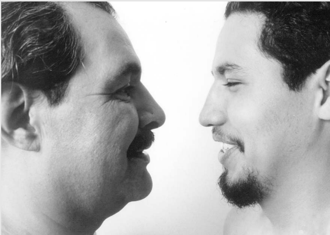
Paternidad afectiva. Calendario Coriac 2001

Marca mi vida el hecho de que mi padre me recibió al nacer. El doctor se fue a dormir, mi madre se agarró de la cabecera y mi padre me recibió. Este hecho afortunado ha equilibrado y fortalecido gratamente mi vínculo con mis padres.