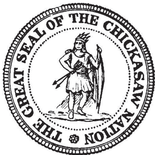
Sello de la Nación Chickasaw < http://freepages.genealogy.rootsweb.ancestry.com/~prsrj/na/seals/seals-idx.htm >.