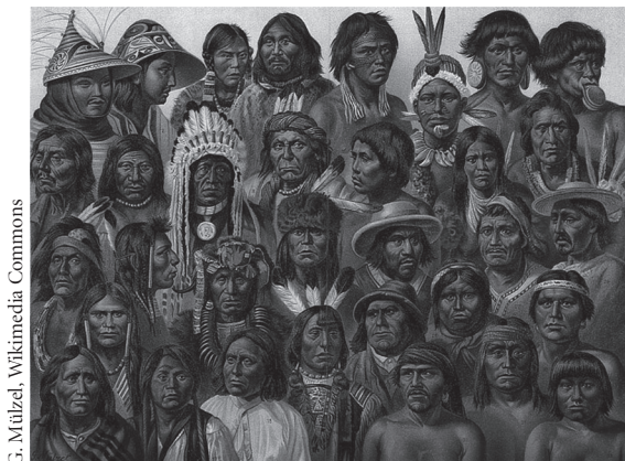
G. Mützel, Wikimedia Commons