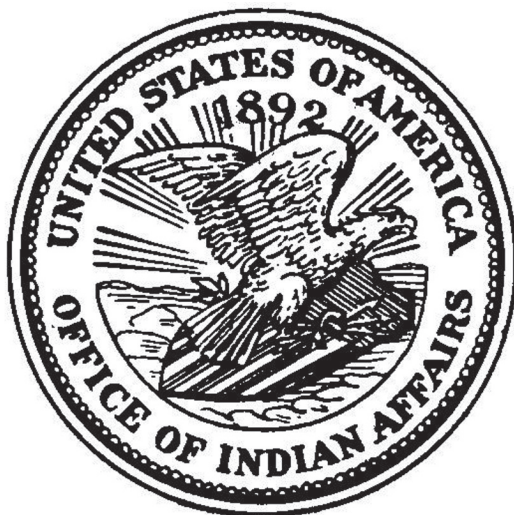
Sello de la Oficina de Asuntos Indígenas (OIA) < http://freepages.genealogy.rootsweb.ancestry.com/~prsjr/na/seals/seals-idx.htm >.