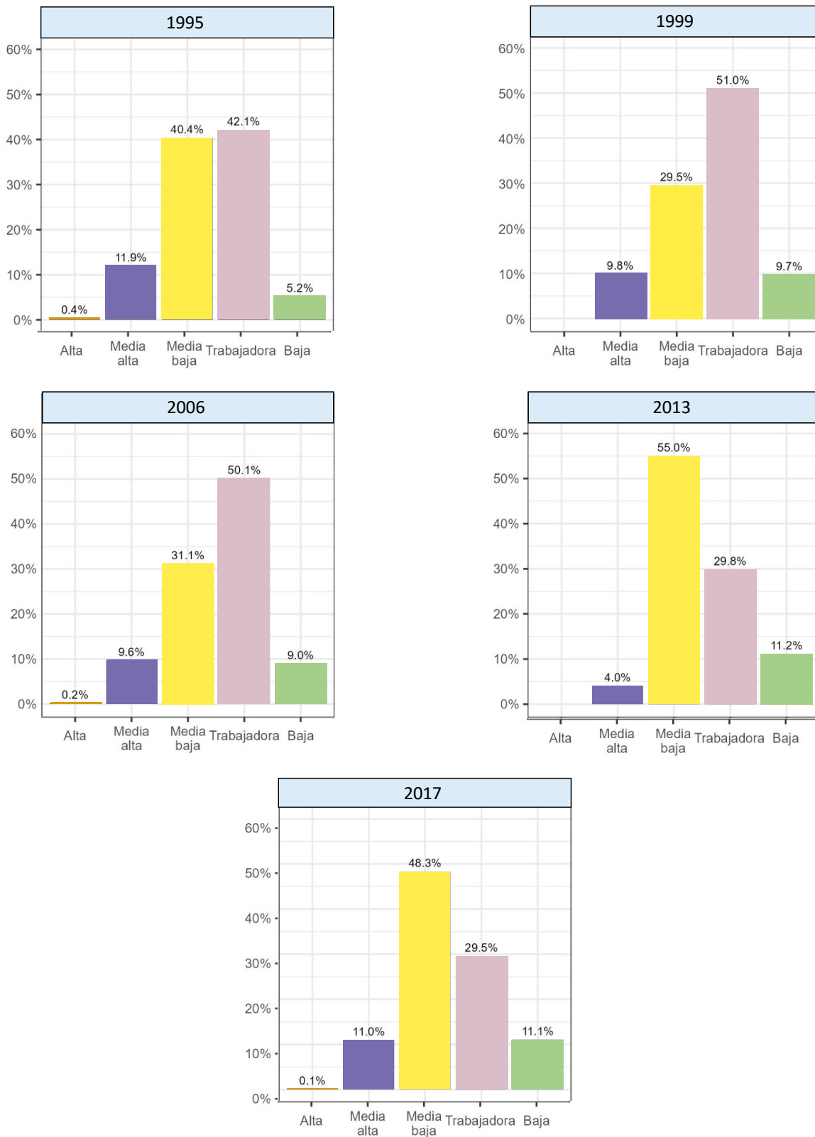
Gráfico 1. Posicionamiento subjetivo de clase en Argentina. 1995, 1999, 2006, 2013, 2017