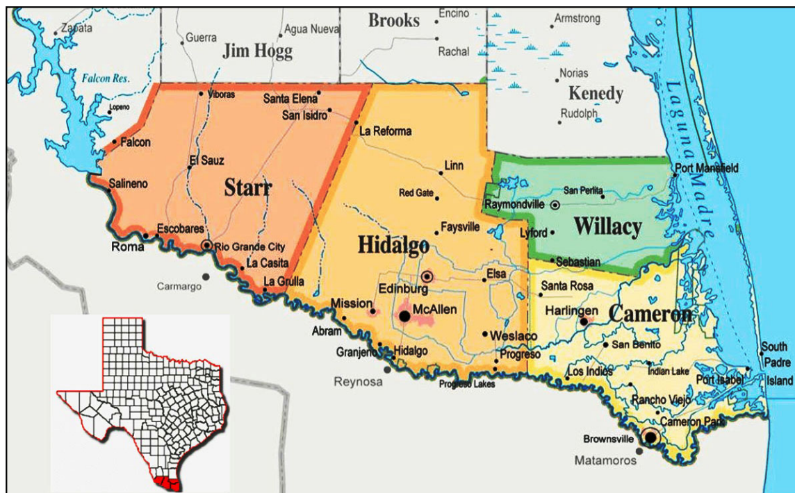
Figura 4: Condados y ciudades del Valle de Río Grande