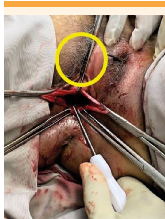
Figura 1. Primer punto en la fascia de la membrana obturatriz del lado izquierdo con aguja helicoidal, en la porción más superior de la membrana obturatriz.

cional de colporrafia anterior no podía llevarse a cabo por la ausencia de fascia prevesical izquierda. La técnica modificada consistía en aplicar dos puntos con poliglactina 910 en la fascia presevesical derecha y suspenderlos en la fascia de la membrana obturatriz del lado izquierdo, con ayuda de una aguja helicoidal. El primer punto se hizo en la porción más superior de la membrana y el segundo en la porción más inferior a fin de lograr una distancia entre ambos puntos de aproximadamente 2 cm ( Figuras 1 y 2 ). Posteriormente, los puntos se anudaron entre sí para garantizar su fijación ( Figura 3 ). Teniendo en mente el daño paravaginal de la paciente se procedió a la colpopexia por vía vaginal, con fijación al ligamento sacroespinoso del lado derecho para disminuir la recidiva. Para aumento de la presión vaginal y disminuir el sangrado se