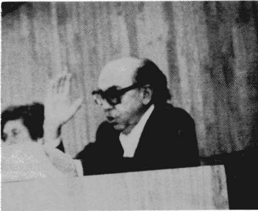
Ángel Bassols Batalla