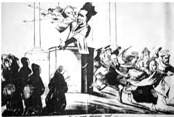
Imagen 3: ¡No se puede aguantar más! , en El Padre Padilla , Santiago, 28 de noviembre, 1884, pp. 2 y 3.

Vemos entonces cómo se critica la contradicción existente entre la mentalidad católica-conservadora y las prácticas efectivas, mostrándonos a estos sectores como hipócritas y aprovechadores.