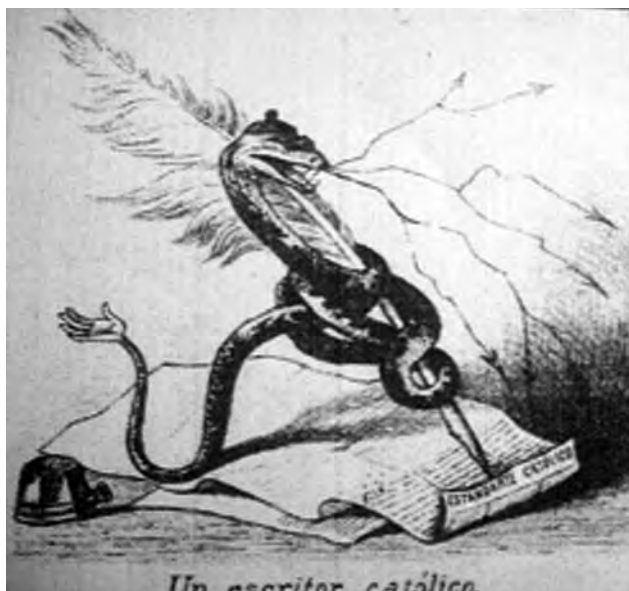
Imagen 4: Un escritor católico , en El Padre Padilla , núm. 258, sábado 1° de abril, 1886.

La imagen 4 resulta llamativa por lo explícito de su crítica a los escritores del más insigne diario conservador de la época: El Estandarte Católico . 19 Es conocido que la serpiente se considera símbolo importante en el mundo cristiano y en la cultura occidental, al vincularse tradicionalmente como un símbolo del mal y de oposición a Dios, 20 por lo que podríamos interpretar que quienes escriben en dicho periódico no siguen el camino de Dios, sino que están contra él.