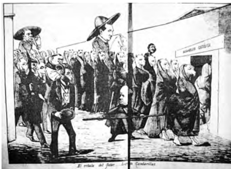
Imagen 2: Mis grabados. El rebaño del señor... Larraín Gandarillas, 14 en El Padre Padilla , Santiago, 4 de noviembre, 1884, pp. 2 y 3.