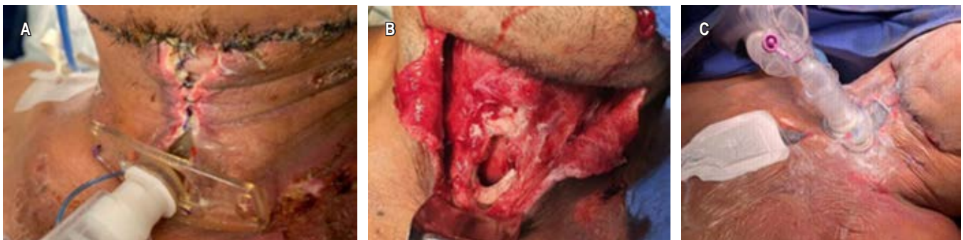
Figura 1: A) Herida cervical dehiscente con material purulento. B) Orificio en cara anterior de la tráquea de 4 cm. C) Resultado después de la primera intervención.

Asimismo, cuando se cuenta con una lesión o defecto grande en la vía aérea, ya sea secundario al proceso infeccioso o como complicación por un procedimiento, es importante poder reconstruir y mantener la integridad de ésta para asegurar una ventilación adecuada y mejorar la morbilidad de los pacientes. En este caso se decidió utilizar una cánula de Montgomery, que normalmente es utilizada para estenosis traqueales no candidatos a tratamiento quirúrgico; no obstante, por las características de la misma,