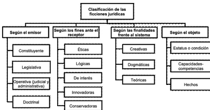
Figura 1. Clasificación de las ficciones jurídicas 20

De cualquier forma, las ficciones pueden responder a diferentes clasificaciones si para ello se siguen los fines que pretenden frente al receptor, el sujeto que las produce, las finalidades dentro del sistema y el objeto de la ficción, como se aprecia en la siguiente figura: