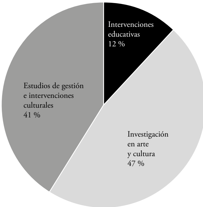
Gráfica 1. Documentos de titulación por categoría

Con base en lo anterior, siete trabajos se ubican en la categoría “Estudios de gestión e intervenciones culturales” (41 %), ocho en “Investigación en arte y cultura” (47%) y dos más en “Intervención educativa” (12%) (ver gráfica 1).