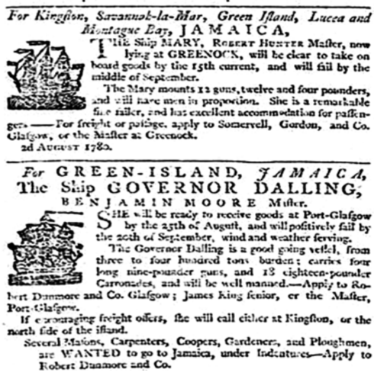
Figura 2. Anuncio clasificado en el periódico