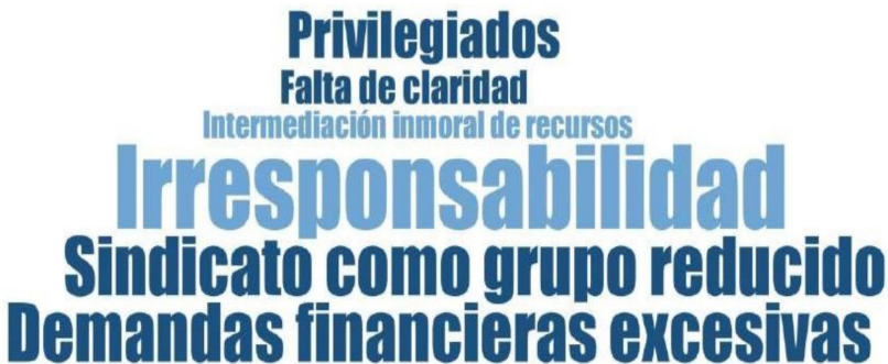
Figura 5. Categorías con las que el Conacyt etiqueta al Siintracátedras