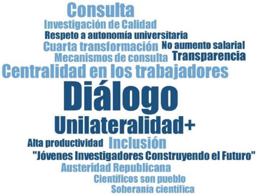
Figura 4. Categorías de autoidentificación en los comunicados del Conacyt.