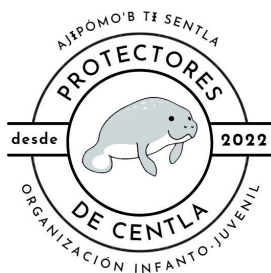
FIGURA 4. PROPUESTA DE LOGOTIPO, ORGANIZACIÓN INFANTO-JUVENIL PROTECTORES DE CENTLA

Nota de la imagen: Elaboración propia a partir de las propuestas de niñas y niños de la comunidad