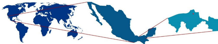
FIGURA 1. UBICACIÓN GEOGRÁFICA EL POBLADO QUINTÍN ARAUZ, TABASCO, MÉXICO

importancia medioambiental de la zona, las desigualdades educativas y las condiciones de aislamiento geográfico del poblado.