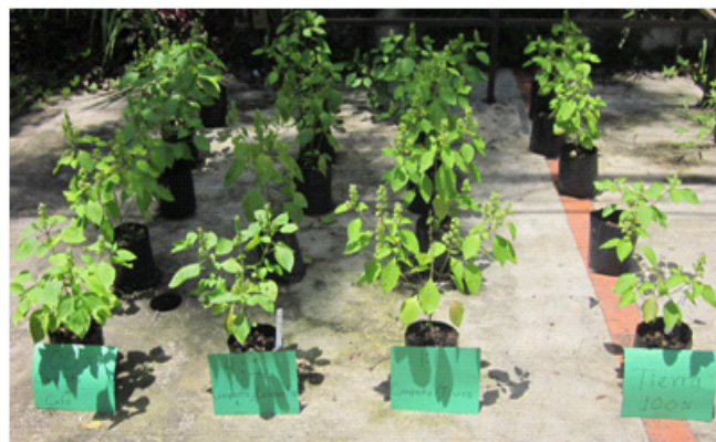
Figura 1. Tratamientos de albahaca con cuatro sustratos. De izquierda a derecha: 100% vermicomposta de café, vermicomposta de café cascarilla de café 4:1, composta tierra 1:1, tierra.

La Figura 2 muestra altura y número de hojas de la albahaca a través del tiempo. La altura de planta presentó diferencias significativas ( < 0.05 ) en las tres etapas de muestreo. Se observó que en el tratamiento con tierra la altura de planta fue superior al inicio del establecimiento y 8 días después del trasplante. Esto se vio favorecido por la mayor capacidad de retención de agua de la tierra, lo cual es crucial en la etapa de adaptación inmediata al trasplante (Cuadro 2). No obstante, a