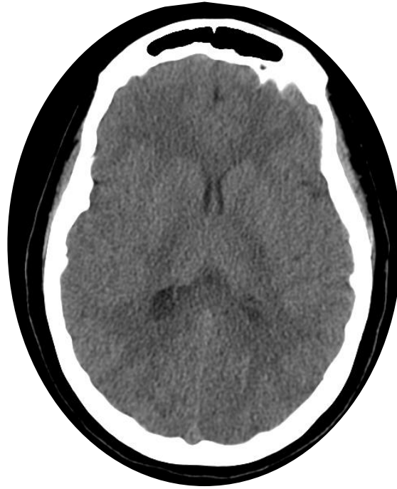
Imagen 1: TAC de cráneo simple que demuestra la ausencia de eventos isquémicos y hemorrágicos.