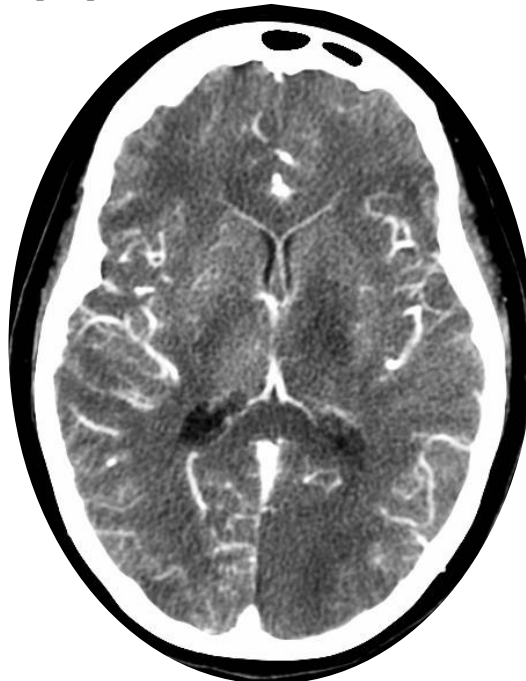
Imagen 2: AngioTAC cerebral que demuestra zona hipodensa hacia la región talámica y globo pálido izquierdo que pudiera corresponder a zona de isquemia.