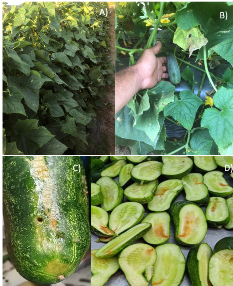
Figura 2. A) Cultivo del pepino, B) pepino con larvas de Diaphania , C) frutos de pepino con perforaciones por larva de Diaphania , D) daño provocado en el interior de frutos de pepino por larvas de Diaphania .