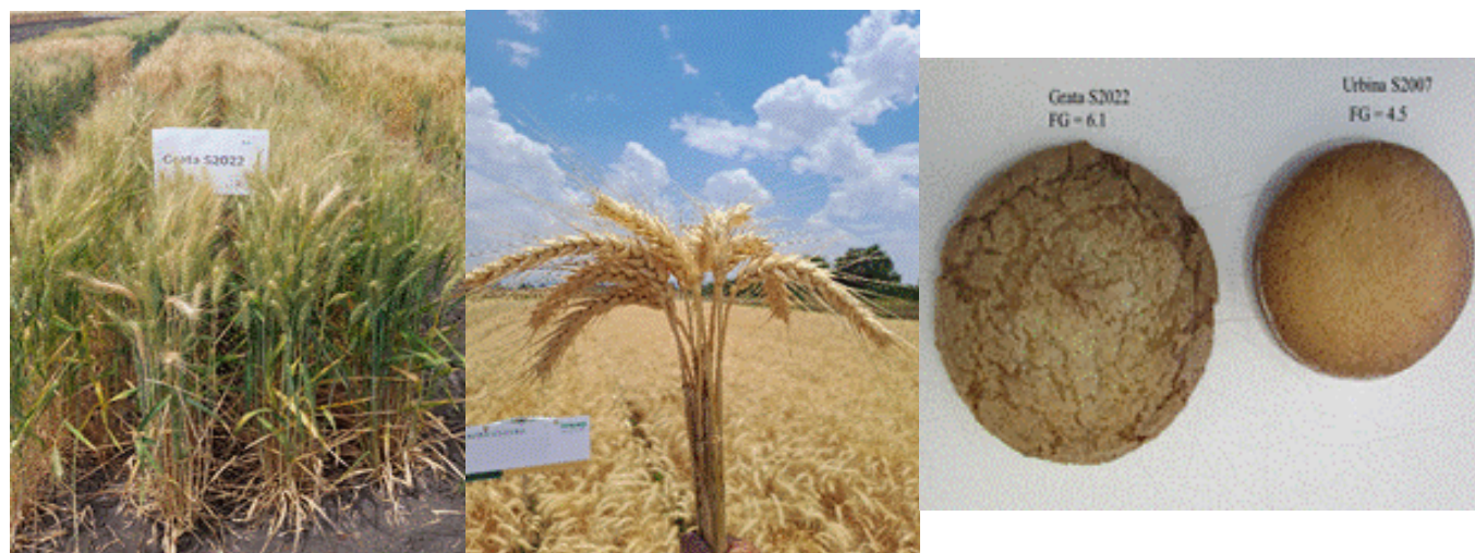
Figura 1. Planta, espigas y factor galletero de Grata S2022 y del testigo Urbina S2007.

Los números entre paréntesis son la cantidad de localidades en cada condición, %Gra: porcentaje de diferencia con respecto a Grata S202, RN: riego normal, RL: riego limitado, Yr: roya amarilla, Lr: roya de la hoja, MR: moderadamente resistente, MS: moderadamente susceptible, S: susceptible. † Lecturas máximas registradas.