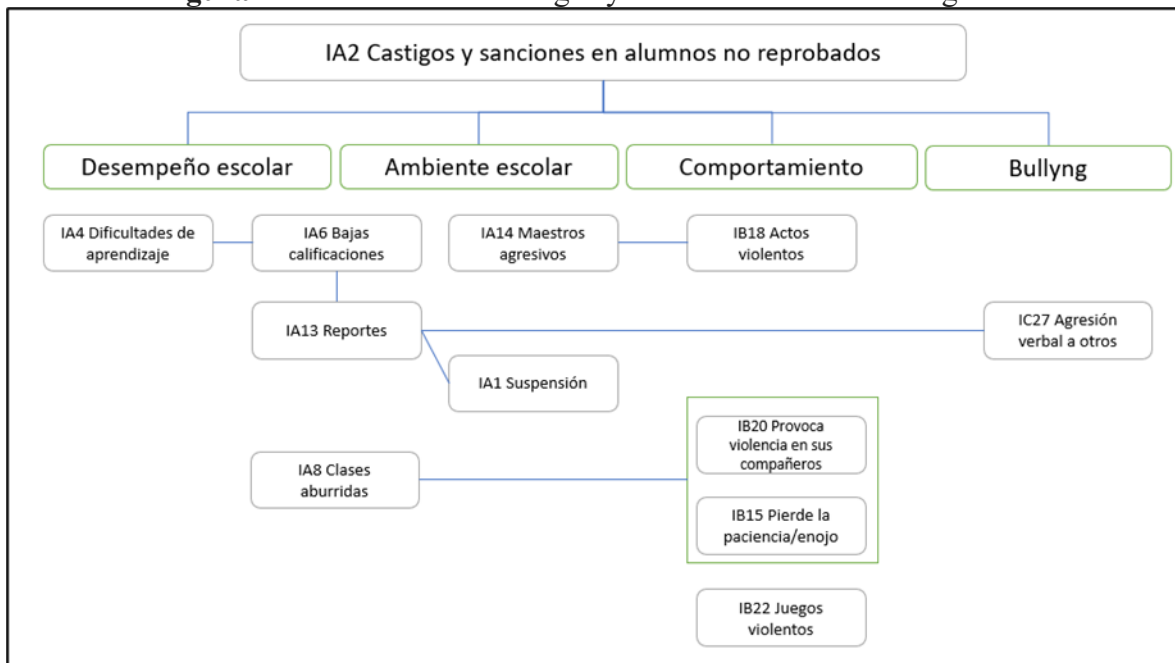
Figura 2. Relación de los castigos y sanciones en alumnos regulares

parte de los alumnos y esto, a su vez, se traduce en sanciones materializadas en suspensiones temporales.