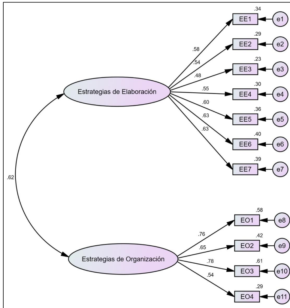
Figura 2. Primera estructura de dos factores de la EBEA