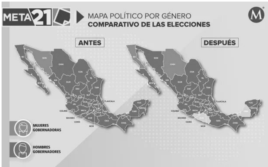
Imagen 1 Mapa gobernadoras antes del 2021

Para finalizar este apartado sobre gobernadoras en la historia se presenta un mapa (Imagen 1) que muestra las gobernadoras previo a las elecciones de 2021, esto es, únicamente 2 de 32 entidades federativas. En contraste, se presentará posteriormente un mapa tras las elecciones del 6 de junio, donde se aprecian los estados que hoy se encuentran gobernados por mujeres.