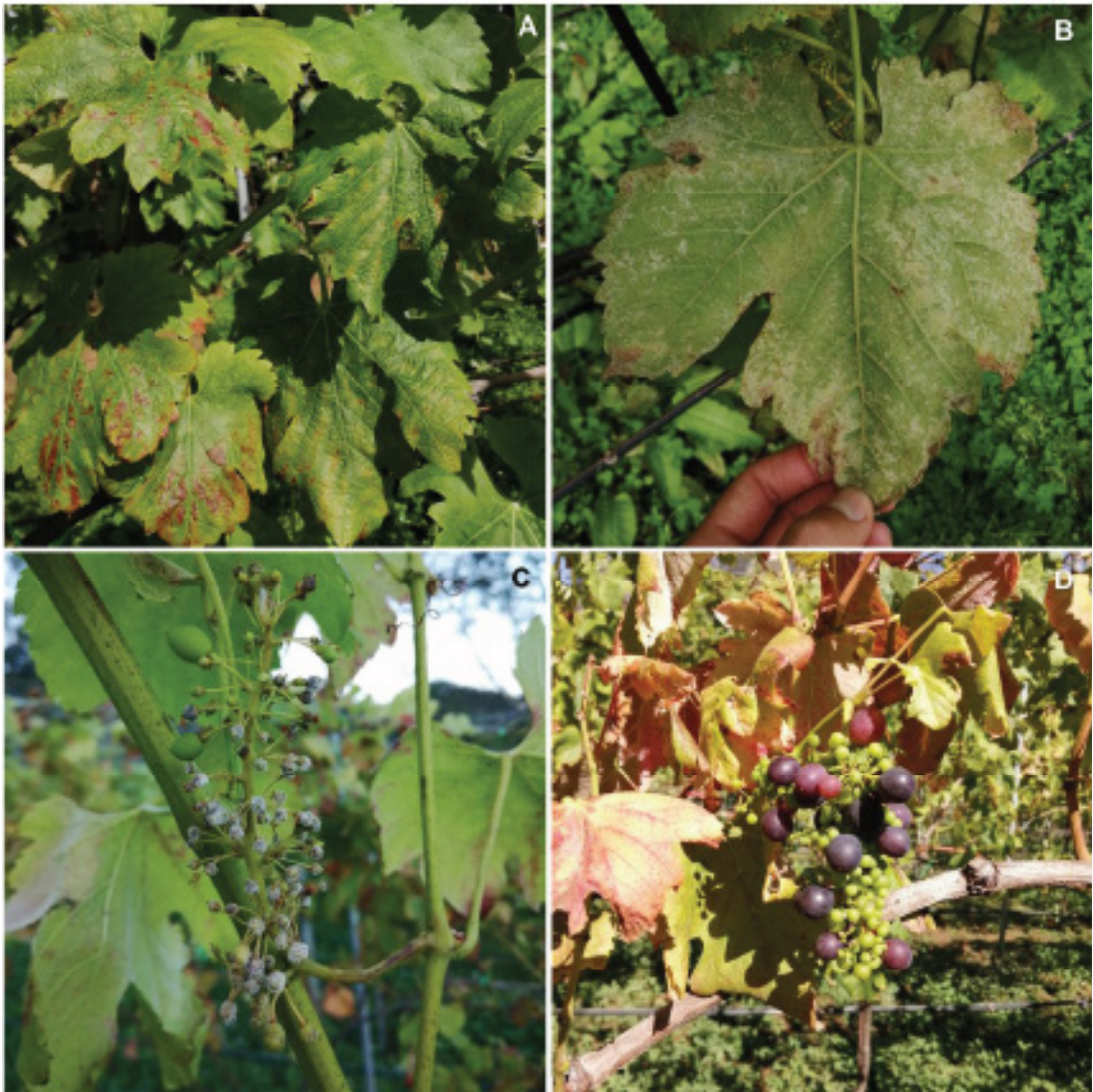
Figure 3. Síntomas y signos característicos del mildiú veloso de la vid ( Vitis vinifera ) causado por el oomicete Plasmopara viticola . A. Clorosis y necrosis foliar. B. Esporulación en el envés de hojas con lesiones necróticas. C. Esporulación en frutos jóvenes. D. Necrosis foliar y pobre llenado de frutos.