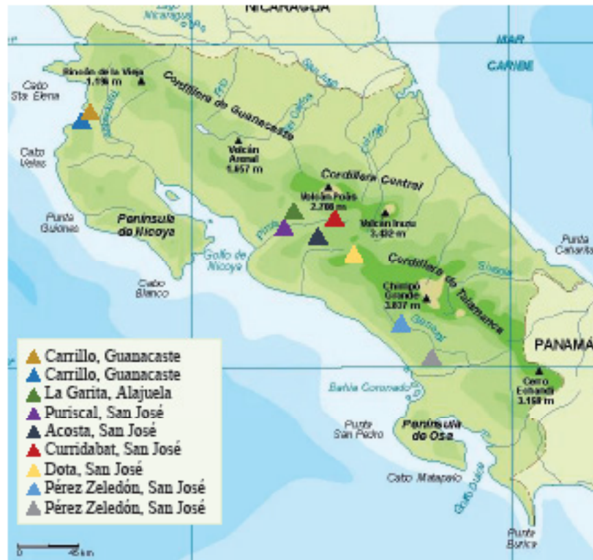
Figura 1. Ubicación de las principales plantaciones de vid en Costa Rica.

las alternativas para el manejo químico de las enfermedades son escasas, puesto que, de acuerdo con la base de datos del Servicio Fitosanitario del Estado (SFE, 2023), al momento, solo dos fungicidas están registrados para uso en la vid: miclobutanil (triazol) y mancozeb (ditiocarbamato). De estos, solo el último está registrado para combatir el mildiú veloso. Esta situación restringe la rentabilidad de los viñedos y la proyección de las pequeñas empresas para insertarse en la cadena comercial.