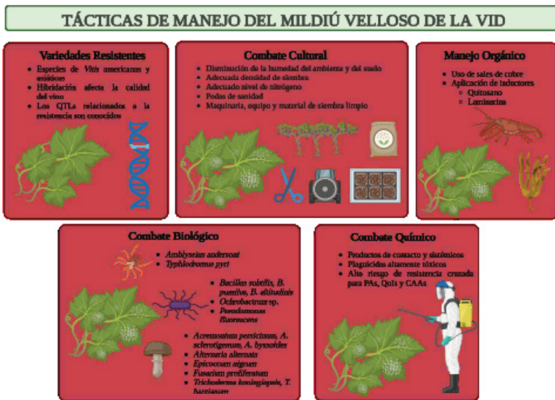
Figure 4. Tácticas (ventajas y desventajas) documentadas para el manejo del mildiú vellosa de la vid ( Vitis vinifera ), causado por el oomicete Plasmopara viticola .

síntomas al fumigar los viñedos con un compuesto elaborado a partir de sulfato de cobre e hidróxido de calcio. La mezcla se popularizó en otras regiones vitícolas del mundo, debido a la fuerte adherencia y persistencia en las plantas, con el nombre de “caldo bordelés”. Desde entonces, las sales de cobre son utilizadas para prevenir infecciones secundarias en los programas de aplicaciones químicas, con variaciones en la composición, dosis e intervalos de aplicación, según la presión de inóculo presente (Lamichhane et al. , 2018; Massi et al. , 2021).