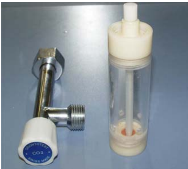
Figura 1. Cilindro plástico odontotest para obtención de lápices de CO 2 Union Broach Corporation™ para pruebas de vitalidad pulpar. Departamento de Ortodoncia del HIMFG.

Se incluyeron 14 pacientes del Servicio de Ortodoncia del HIMFG, que fueron sometidos a cirugía ortog-