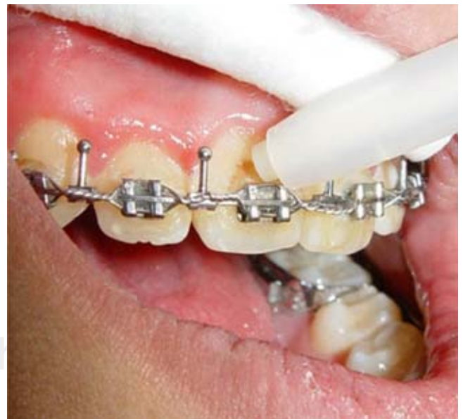
Figura 2. Fotografía del paciente del Servicio de Ortodoncia del HIMFG, aspecto labial que muestra el aislamiento relativo, para la realización de pruebas de vitalidad pulpar, nótese que la punta del lápiz de CO 2 se aplica lo más cerca posible de la base del bracket teniendo la precaución de no tocar tejido gingival.