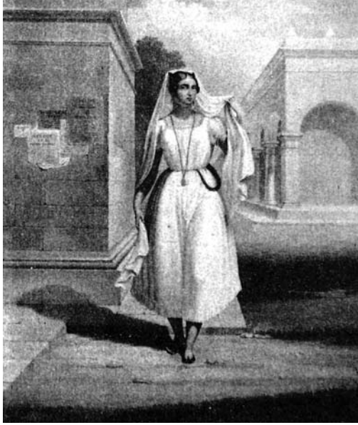
FIGURA 3. Traje de las mujeres en Campeche.

tomada por las tropas norteamericanas y tiempo después se firmaron los tratados de Guadalupe-Hidalgo, en los que México reconoció la pérdida de más de la mitad de su territorio. 44 Como señalé anteriormente y ante las dificultades que las autoridades locales enfrentaron durante la rebelión indígena, en agosto de 1848 firmaron los acuerdos de reincorporación al territorio mexicano a cambio de apoyo económico y tropas. Mientras tanto, la gente que huyó de la zona de conflicto se estableció en el puerto, situación que produjo escasez de productos básicos, falta de vivienda, el hacinamiento de asentamientos provisionales y la amenaza de epidemias, por lo que se habilitó el edificio de San Lázaro como albergue y se construyó un nuevo cementerio. 45