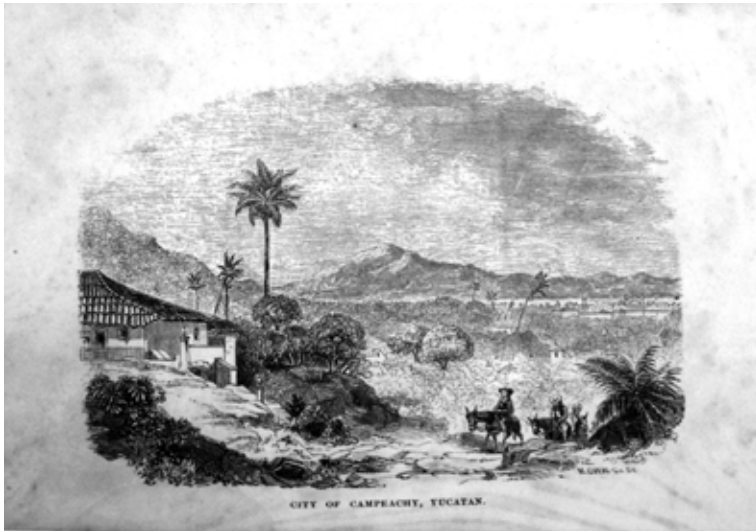
FIGURA 2. Campeche extramuros.

a América Central 42 y a Campeche, llegó el 5 de marzo de 1847, donde su estancia fue breve porque su intención era recorrer la región en busca de mayor contacto con la naturaleza. 43 En su país de origen continuó dedicándose a la actividad científica y falleció el 9 de octubre de 1892.