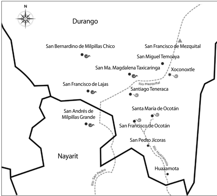
MAPA I. Comunidades y variantes lingüísticas de los tepehuanes del sur