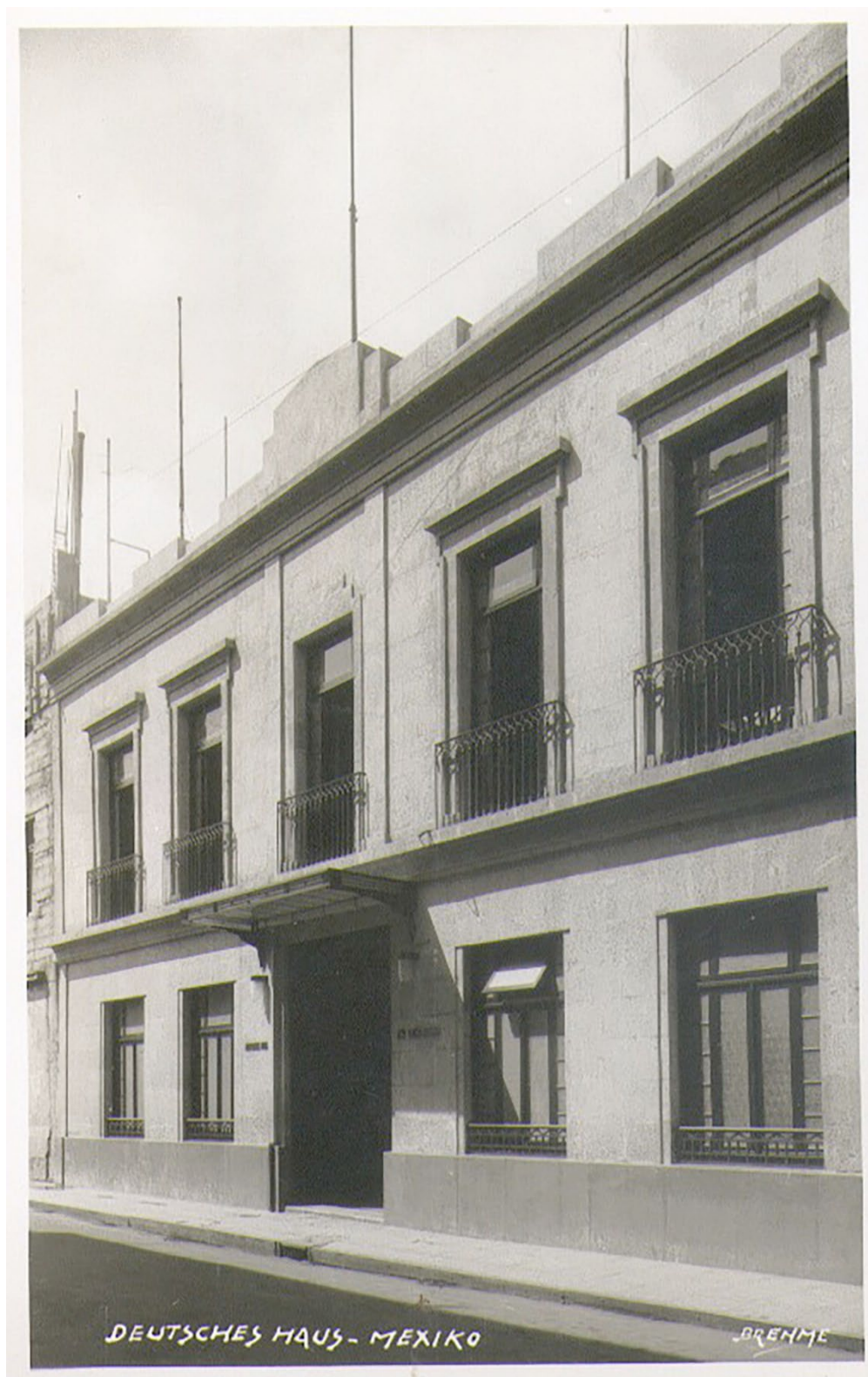
Figura 1. Fachada del Casino Alemán