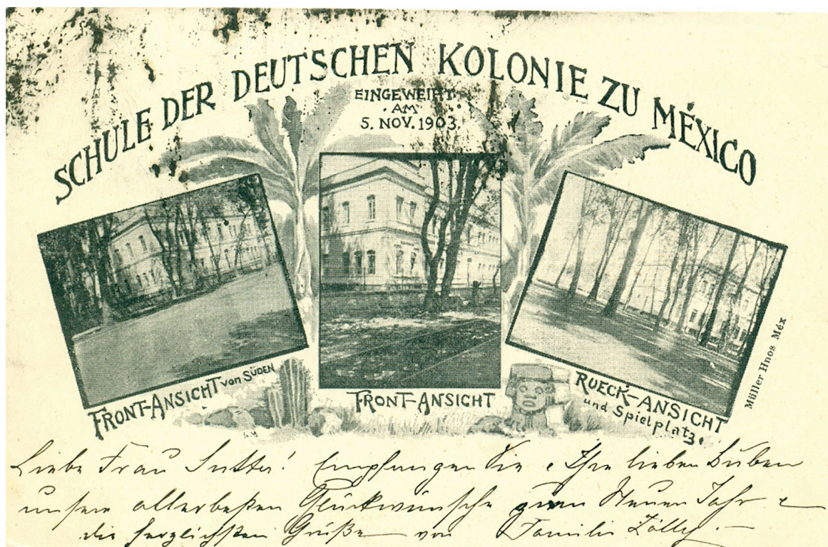
Figura 6. Postal del Colegio Alemán