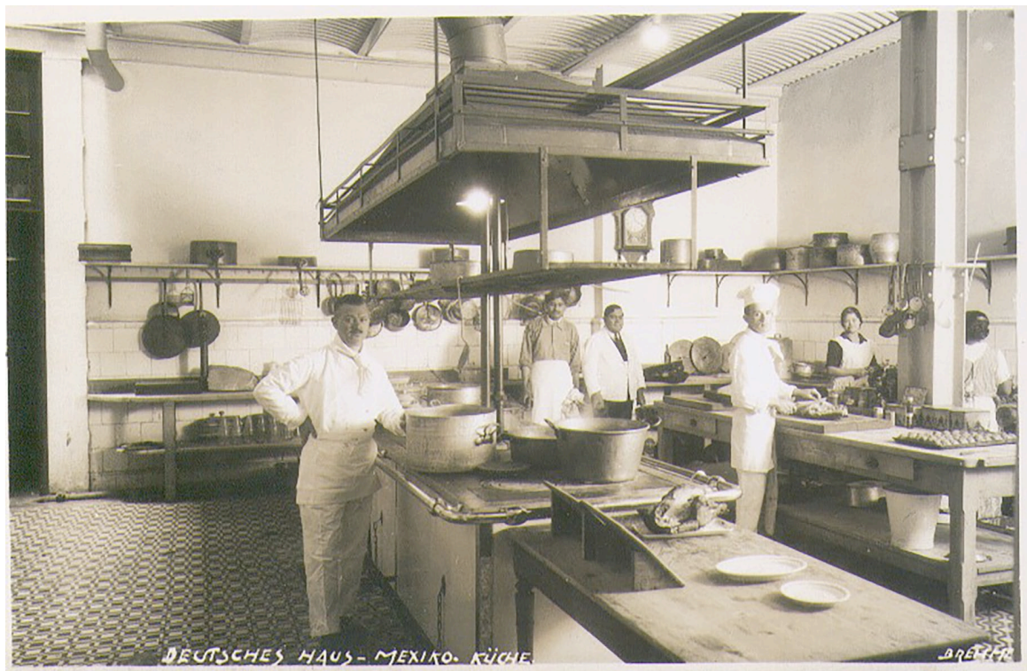
Figura 3. Cocina del Casino Alemán