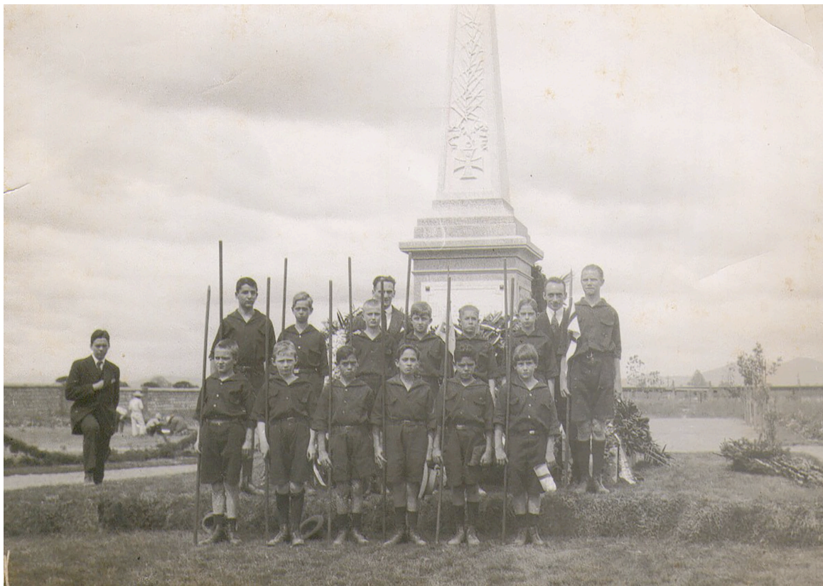
Figura 4. Pfadfinder (excursionistas) del Colegio Alemán