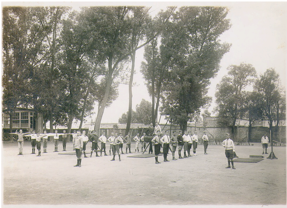
Figura 5. Ejercicios de gimnasia en el patio del Colegio Alemán