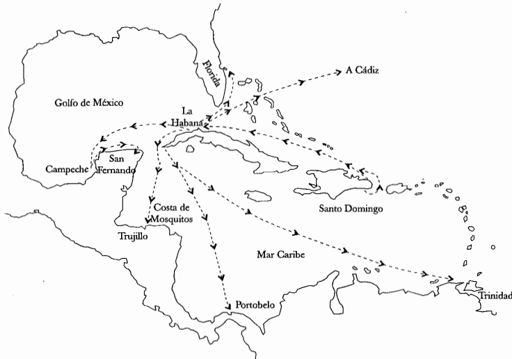
Mapa 1. Área de dispersión de las Tropas Auxiliares de Jorge Biassou y Juan Francisco

Fuente: Elaboración propia.