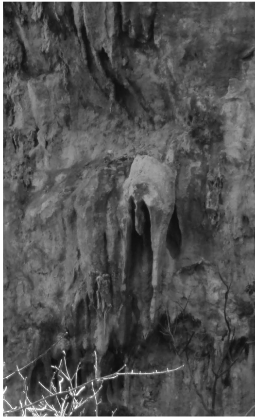
Figura 2. Formación rocosa que representa la parte posterior de un venado.

apoyaron para realizar el estudio etnozoológico del cual emana el presente trabajo, por su disposición, amistad y compañía. Se agradece también al CIIDIR-IPN-Unidad Oaxaca y al Instituto Tecnológico del Valle de Oaxaca (ITVO), así como a los académicos de ambas instituciones de investigación y educativas, quienes dirigieron y apoyaron la realización del presente trabajo.