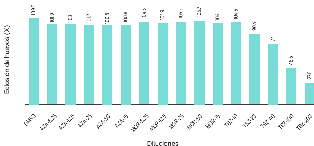
Figura 1. Media de eclosión de huevos en diferentes extractos de Azadirachta indica (AZA), Moringa oleifera (MOR), tiabendazol (TBZ) y dimetilsulfóxido (DMSO) como control negativo.

a, b, c, d= literales diferentes en la misma columna indican diferencias (P < 0.05).